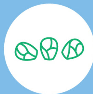
Choux de Bruxelles